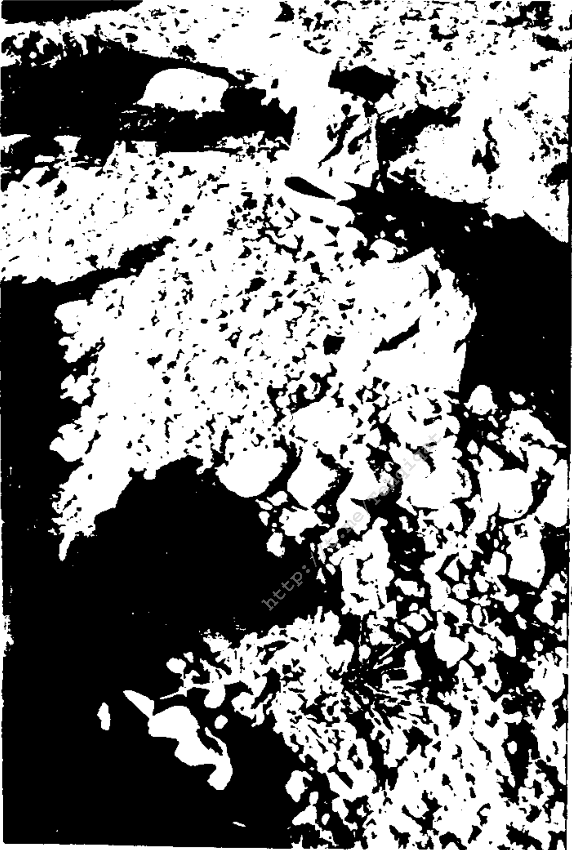
عکس مزار مولوی احمد یار برادر مولانا قادر بخش (بارکھان)